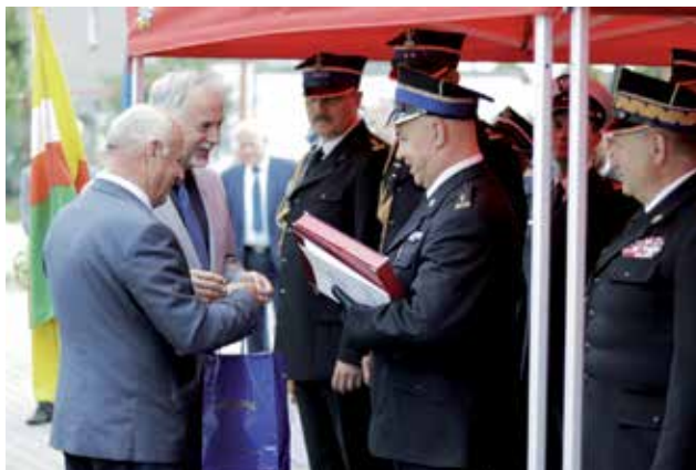
Wręczenie pamiątkowej patery przez Starostów.

Dziękujemy za wieloletnią współpracę. Życzymy sukcesów w realizacji wszystkich życiowych zamierzeń oraz wszelkiej pomyślności w życiu osobistym