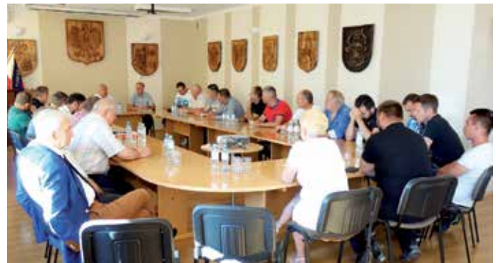
Spotkanie rolników ze Starostami.

Podobna sytuacja jest na użytkach zielonych, gdzie po zebrałym pierwszym pokosie, brak jest w 100% odrostu traw, co powoduje brak zielonej paszy dla bydła mlecznego i opasowego. Rolnictwo to taka branża, dział gospodarki, które w bardzo dużym stopniu uzależnione jest od czynników atmosferycznych. Rolnicy w większości ubezpieczają uprawy rolne od niekorzystnych czynników atmosferycznych, które są dotowane przez Państwo np. grad, przymrozki wiosenne, ogień. Niestety suszy dotacje nie obejmują, a bez wsparcia Państwa rolnicy nie są w stanie opłacić tak wysokich składek. Po dwóch skrajnie niekorzystnych okresach wegetacyjnych bez wsparcia finansowego Rządu do wielu gospodarstw rolnych zawita komornik, a następnie widmo bankructwa. Rolnicy zwracają się z uprzejmą prośbą o ogłoszenie stanu klęski żywiołowej spowodowanej suszą, a tym samym udzielenie pomocy finansowej do każdego hektara użytków rolnych objętych suszą.