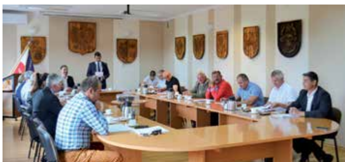
XXXIX sesja rady powiatu strzelecko – drezdeneckiego