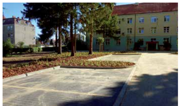
Nowo powstały parking.

W dniu 06.06.2018 r. został oddany do użytku parking dla samochodów osobowych wraz z ciągiem komunikacyjnym przy ul. ks. S. Wyszyńskiego w Strzelcach Krajeńskich. W ramach inwestycji przeprowadzono następujące roboty budowlane: rozbiórkę nawierzchni, wykonanie korytowania, wykonanie konstrukcji jezdni, chodników, miejsc postojowych, wykonanie wiaty, ławek, koszy oraz monitoringu. Ponadto inwestycja objęła: wycinkę drzew i krzewów oraz wykonania nasadzeń zastępczych. Całkowita wartość inwestycji