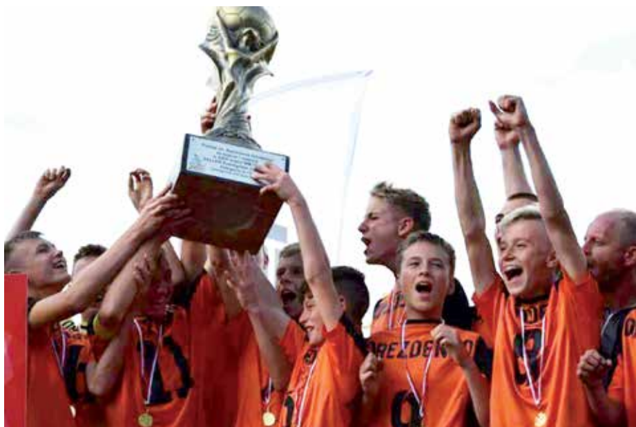
Radość po zwycięstwie w finale widoczna gołym okiem

Wybierając się na tygodniowy turniej jechaliśmy z nastawieniem na dobrą zabawę (piłka ma sprawiać radość), spędzenie ze sobą wspólnego czasu i zintegrowanie się. Ze strony sportowej mieliśmy być ciągle wierni swojemu modelowi gry, który cały czas trenujemy! Jesteśmy podwójnie