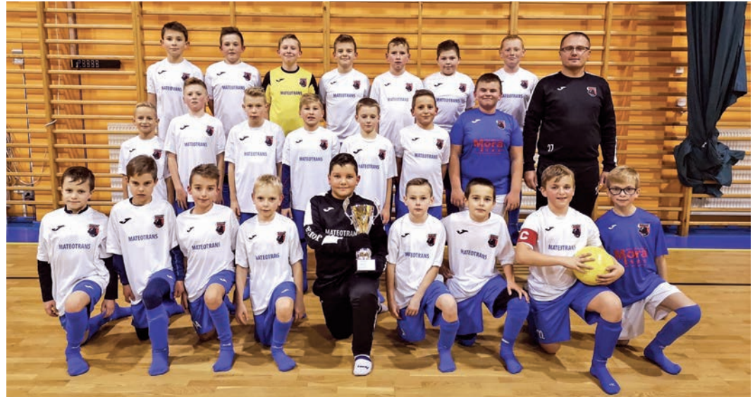
Tabela z punktacją dla danej rozgrywki (Drużyna Orlików)