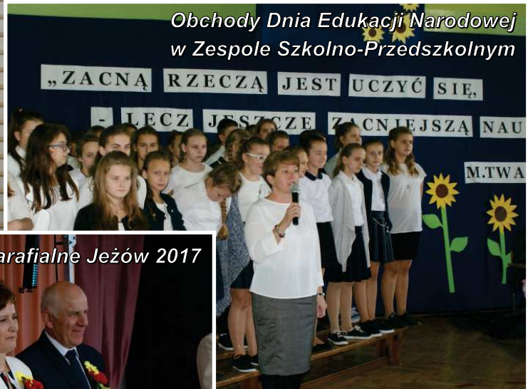
Dożynki Gminno-Parafialne Jezów 2017