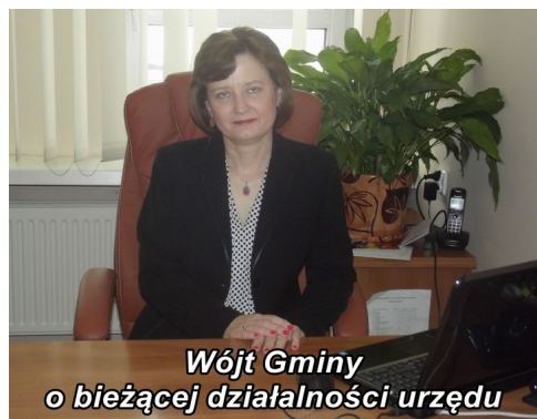
Wójt Gminy o bieżącej działalności urzędu

W wyniku przeprowadzonego w dniu 29.06.2017 r. postępowania w trybie przetargu nieograniczonego pn. „Dowóz uczniów do Szkoły Podstawowej i Gminnego Przedszkola w Jeżowie w roku szkolnym 2017/2018, 2018/2019, 2019/2020” w dniu 25 lipca 2017 r. podpisana została umowa na realizację w/w zadania. Do realizacji wybrano jako najkorzystniejszą ofertę złożoną przez Pana Krzysztofa Sadowskiego ze Szczawina Dużego (gm. Smardzew), gdyż oferta ta uzyskała najwyższą punktację w kryteriach oceny ofert – łącznie 100 pkt, w tym: w kryterium ceny 60 pkt (cena oferty z podatkiem VAT 629.370,00 zł), w kryterium terminu płatności faktur w ilości 30 dni od przyjęcia i zatwierdzenia faktury 40 pkt. W przedmiotowym postępowaniu złożono dwie oferty.