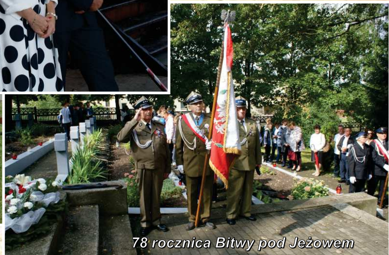
78 rocznica Bitwy pod Jezowem