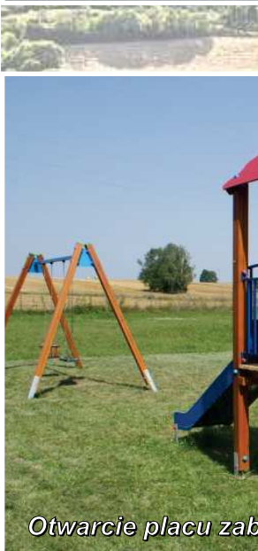
Otwarcie placu zabaw w Górze