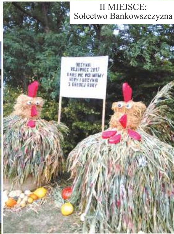
II MIEJSCE: Sołectwo Bańkowszczyzna