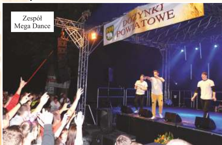
Zespół Mega Dance

Po niej na scenie pojawiła się formacja Mega Dance. Ta zyskała duże uznanie młodzieży.