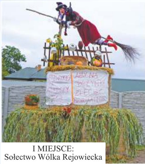
I MIEJSCE: Sołectwo Wólka Rejowiecka