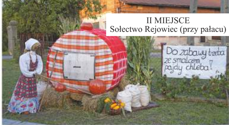
II MIEJSCE Sołectwo Rejowiec (przy pałacu)