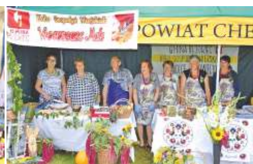
KGW Wereszcze Małe i Wólka Rejowiecka