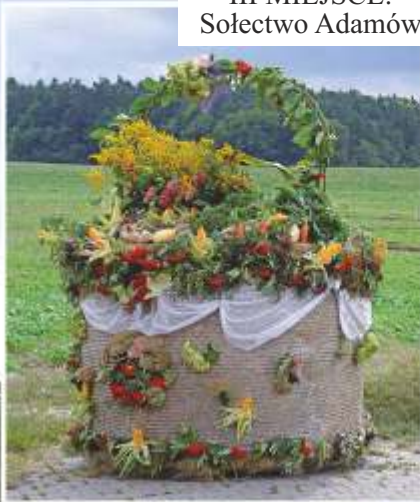
III MIEJSCE: Sołectwo Adamów