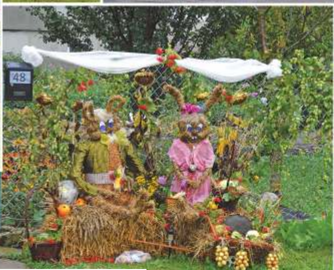
III MIEJSCE: Sołectwo Leonów (Pani Gryglewska)