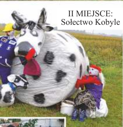
II MIEJSCE: Sołectwo Kobyle