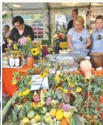
KGW Adamów i Marysin