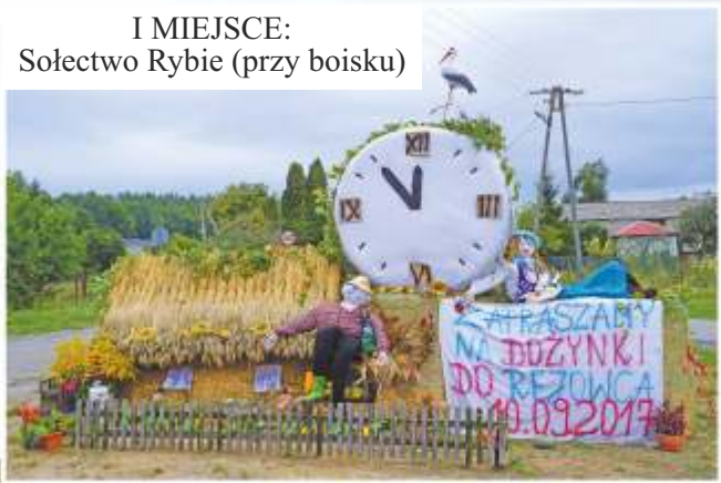
I MIEJSCE: Sołectwo Rybie (przy boisku)