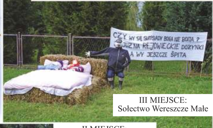
III MIEJSCE: Sołectwo Wereszcze Małe