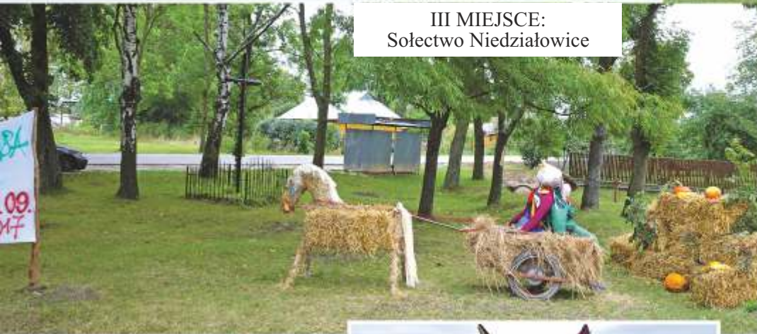
III MIEJSCE: Sołectwo Niedziałowice