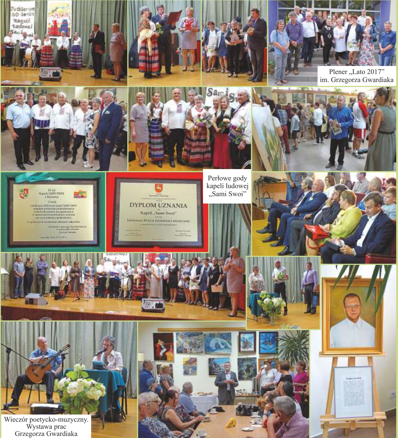
Plener „Lato 2017” im. Grzegorza Gwardiaka