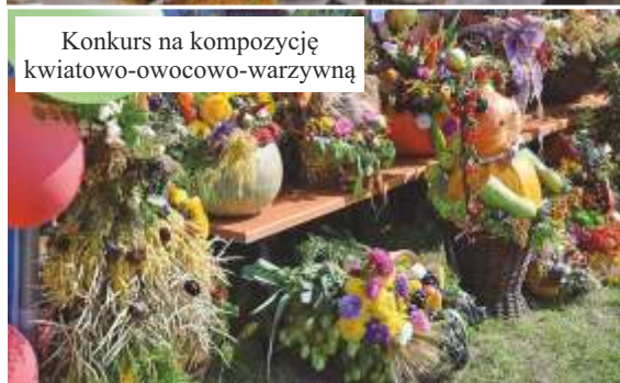
Konkurs na kompozycję kwiatowo-owocowo-warzywną