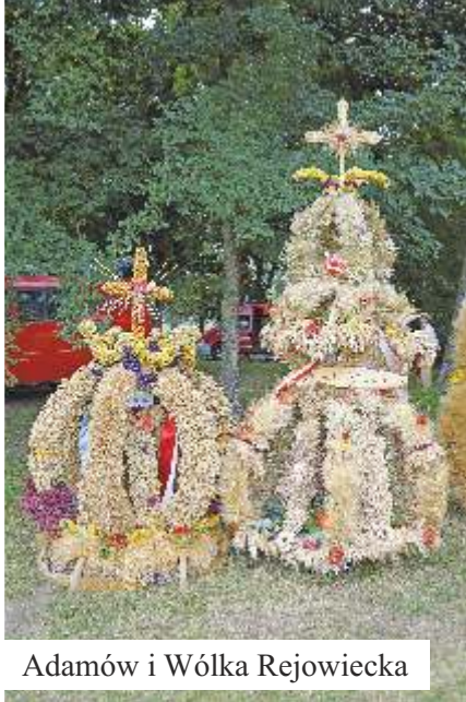
Adamów i Wólka Rejowiecka