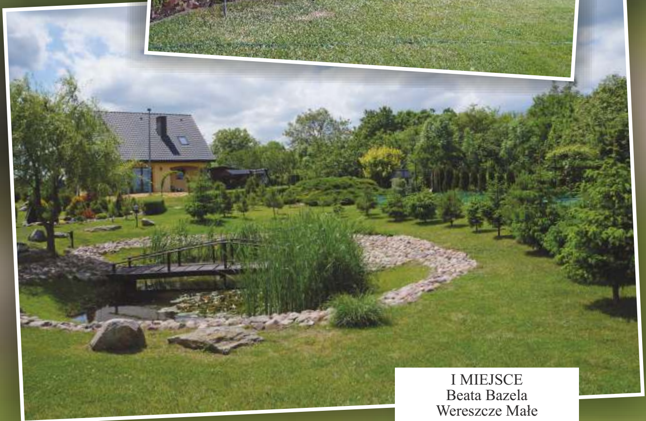
I MIEJSCE Beata Bazela Wereszcze Małe