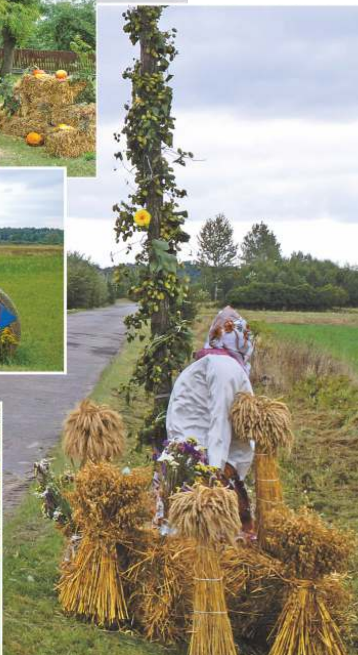
III MIEJSCE: Sołectwo Czechów Kąt i Zagrody