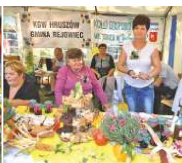
KGW Siedliszczki i Hruszów