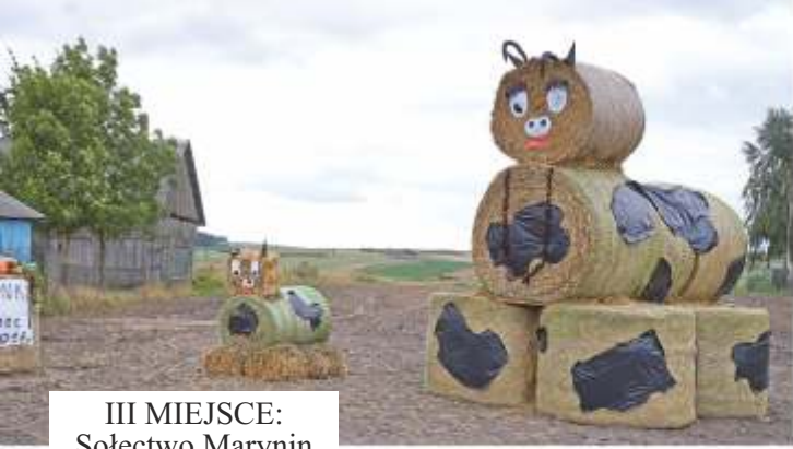
III MIEJSCE: Sołectwo Marynin