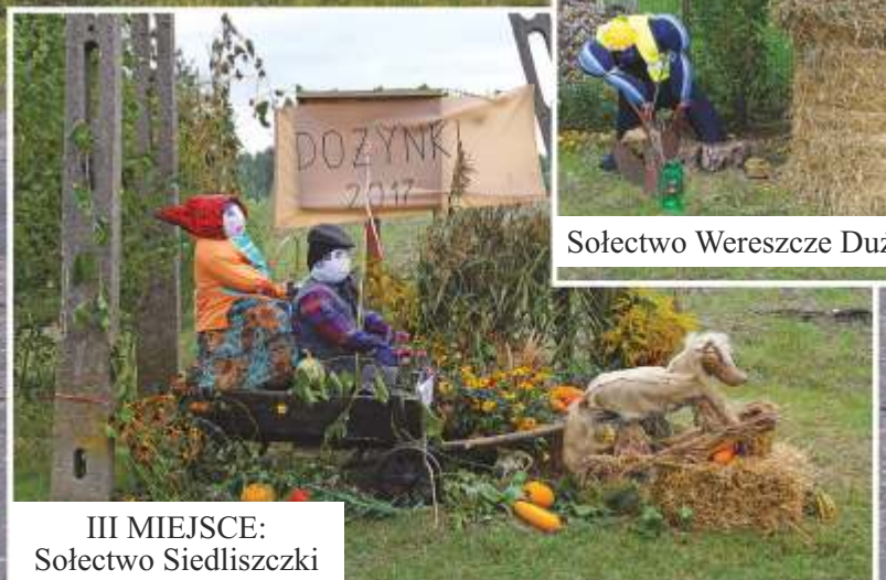
III MIEJSCE: Sołectwo Siedliszczki