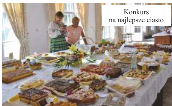
Konkurs na najlepsze ciasto