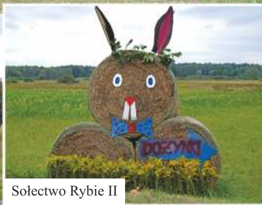
Sołectwo Rybie II